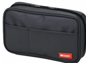
Funda para lápices suaves