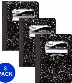
3 libros de composición encuadrados en costura

Gracias de antemano por resistir otra experiencia de compra de regreso a la escuela. Como padres y maestros, sentimos su dolor. Si algo no está claro, por favor envíenos un correo electrónico. Para mayor comodidad, todas las imágenes están vinculadas a Amazon, ¡pero siéntase libre de comprar donde elija!