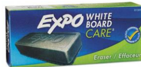
Borrador de pizarra blanca o calcetín limpio