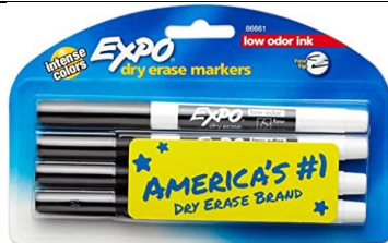
Cuatro marcadores de borrado en seco de punta fina