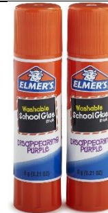
Dos barras de pegamento