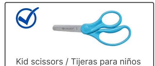
Kid scissors / Tijeras para niños