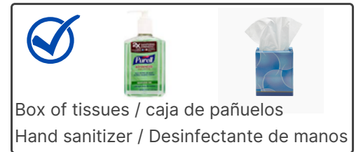
Box of tissues / caja de pañuelos Hand sanitizer / Desinfectante de manos