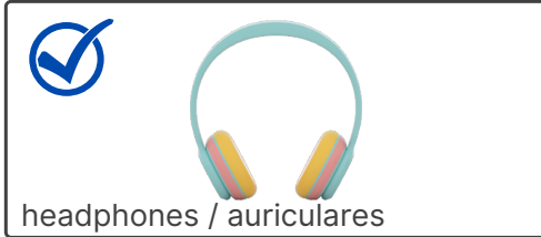
headphones / auriculares