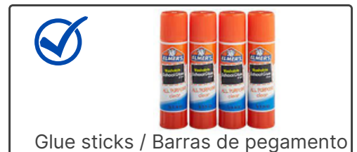
Glue sticks / Barras de pegamento