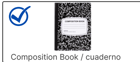
Composition Book / cuaderno