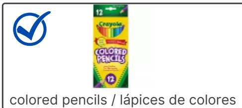
colored pencils / lápices de colores