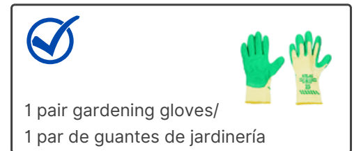
1 pair gardening gloves/ 1 par de guantes de jardinería