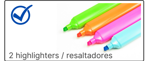
2 highlighters / resaltadores