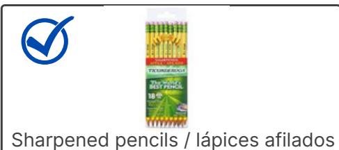
Sharpened pencils / lápices afilados