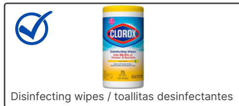
Disinfecting wipes / toallitas desinfectantes