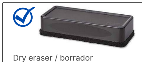
Dry eraser / borrador