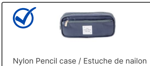
Nylon Pencil case / Estuche de nailon