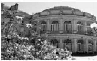
b. les portes Mordelaises